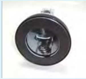
キーを収納できる!