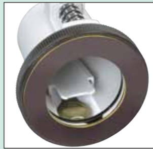
キーを収納できる!