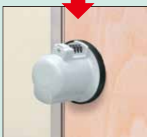
鍵の無いドアをロック!